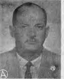
Mayor JUAN FELIX BONILLA SARAVIA Comandante Militar del Aeropuerto de El Coco