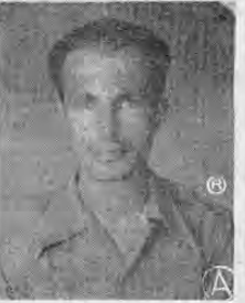
Mayor ALVARO COLLADO MONTEALEGRE Inspector General de Armamento