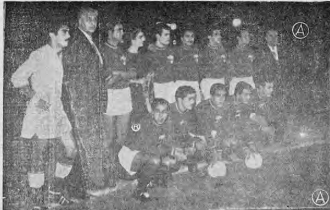
La selección mexicana que únicamente un punto ha conseguido en las veces que ha participado en Mundiales, y que fue casualmente contra Gales al empatar a un gol, no le dan ninguna esperanza de poder llegar a las finales. Igualmente tienen catalogados a Colombia y Bulgaria.

Se han tenido hoy buenas noticias de los jugadores lesionados o enfermos.