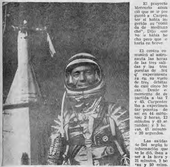
La grática del astronauta norteamericano fue tomada recientemente, cuando el hoy héroe del espacio se disponía a emprender su viaje alrededor del mundo. En aquella oportunidad, el vuelo fue suspendido debido a malas condiciones atmosféricas.