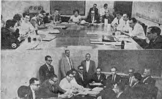
Se efectuó ayer a las 9 a. m., la segunda sesión de trabajo del Seminario Centroamericano de Ciencias, en el Salón de Sesiones de la Facultad de Ciencias Económicas de la Universidad Nacional. La gráfica recoge un aspecto de sus Comisiones de Trabajo que abordaron el tema "Planeamiento del Instituto Centroamericano de Verano para Ciencias".