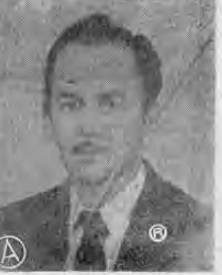
Mayor RENATO GAMBOA VEGA Capitán de Puerto de Limón con recargo de Migración