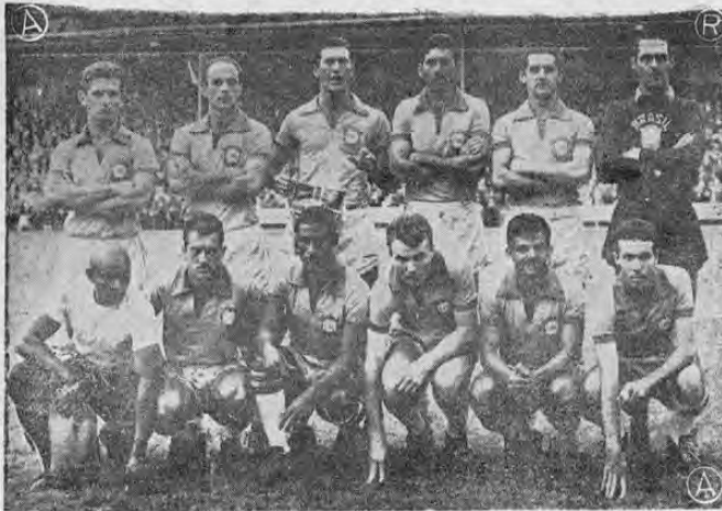
Sigue siendo Brasil favorito para retener el título mundial de fútbol y los críticos se preguntan: ¿Igualará el record establecido por Italia en 1930 al ganar dos veces consecutivas el campeonato?

SANTIAGO DE CHILE, 24. AP— Brasil, el Campeón Mundial de Fútbol que va a defender su título sigue siendo uno de los principales favoritos para obtener el Campeonato por la Segunda vez consecutiva, igualando el record establecido por Italia en 1930.