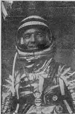
Malcolm Scott Carpenter otro héroe del espacio

LA HAZAÑA DE LA CIENCIA ESPACIAL DE EE. UU. TIENE GRAN RESONANCIA MUNDIAL