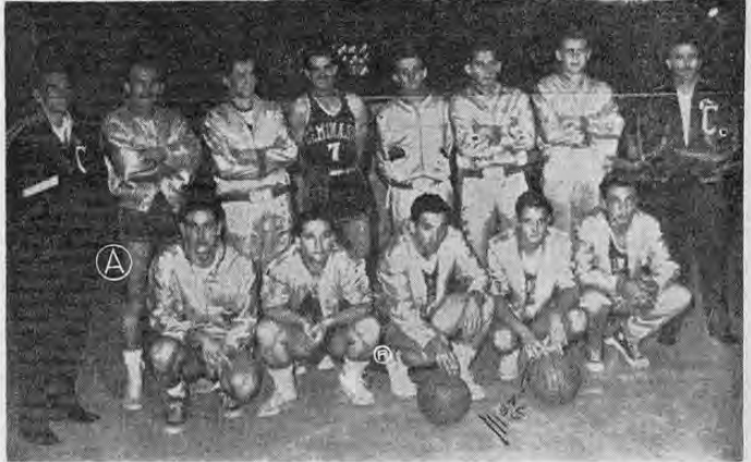
Los campeones nacionales del año anterior, el Seminario, abren la temporada esta noche, enfrentándose al aguerrido Amón.